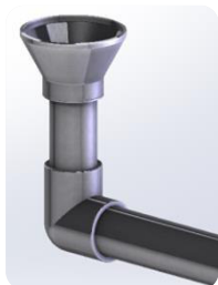
▪ Cone diffuser ▪ Cono difusor