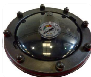
▪ Black top lid with screws ▪ Tapa superior negra con tornillos