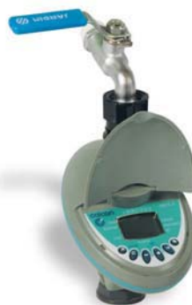
Conexión rápida y fácil a un grifo de jardín